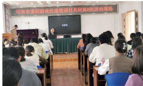
句容市课程游戏化建设项目共同体研讨活动现场

4月16日,句容市课程游戏化建设项目建设共同体B组开展资源库建设研讨活动,园长、教师一行70余人先后参观了句容市宝华大学印象幼儿园、春城中心幼儿园、袁巷中心幼儿园的园所资源库,对班级、年级、园级三级资源库建设有了进一步的了解。