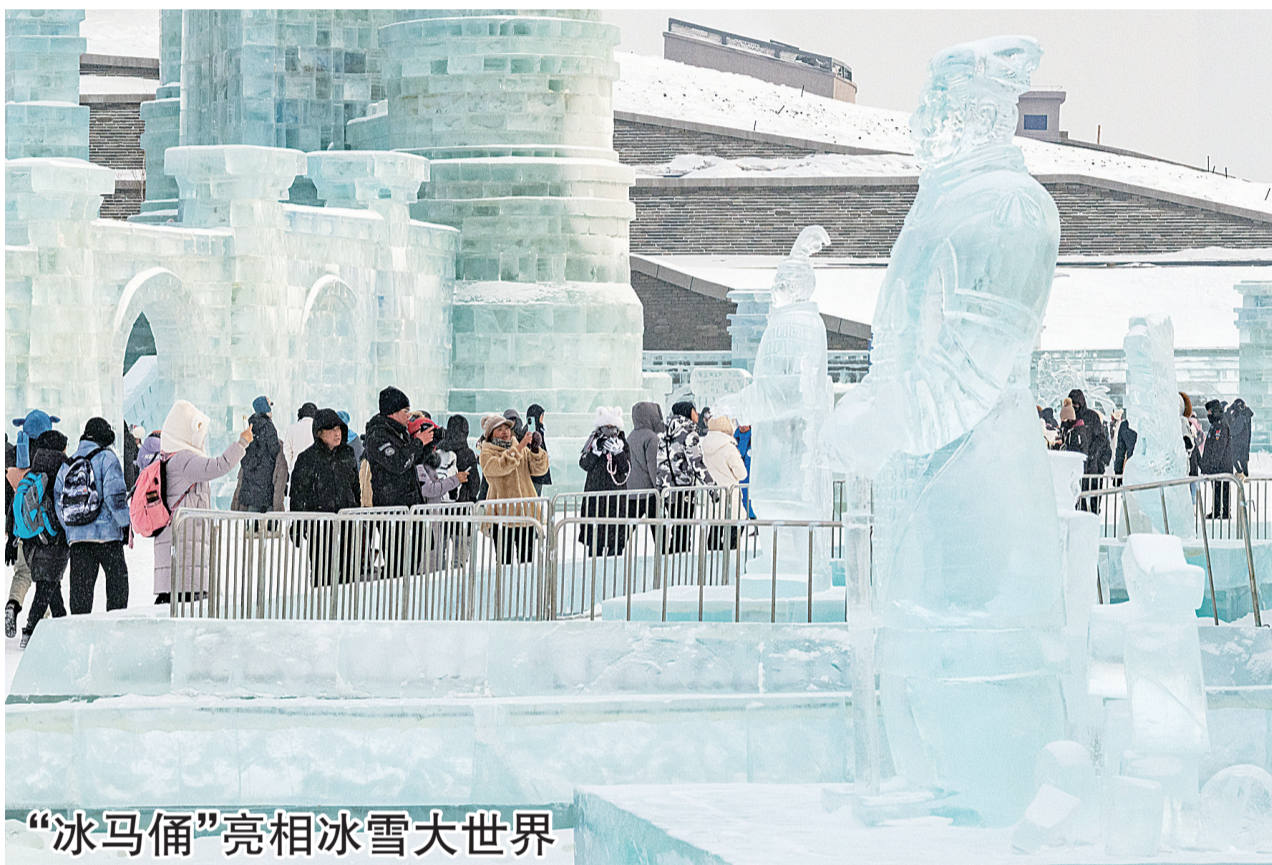
“冰马俑”亮相冰雪大世界

据新华社昆明1月23日电 记者从云南省昭通市镇雄县“1·22”山体滑坡灾害处置指挥部获悉,截至1月23日17时40分,共搜救出31名失联人员,均无生命体征。实施紧急转移安置223户918人。 目前,现场共有省、市、县救援力量1000余人,搜救犬81只,挖机、装载机、运输救援车辆150余台(辆)参与救援,现场部署6支专业搜救分队,利用雷达生命探测仪、音视频探测仪、无人机、搜救犬等技术手段,在3个区域开展搜救作业。