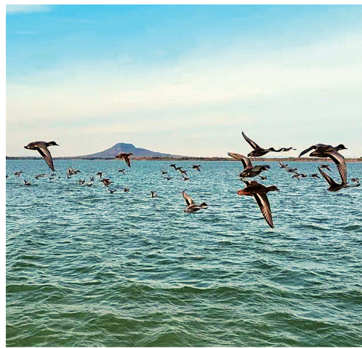
美丽的赤山湖湿地公园