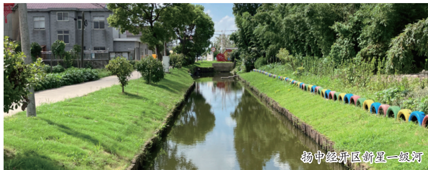
扬中经开区新里一级河

本报讯(朱浩 黄良建)绿柳碧波穿村过巷,两岸绿植郁郁葱葱。行走于如今的扬中兴隆港,亲水平台设计新颖、游青路面干净整洁、水生植物布局合理、建筑立面加固出新,河道整体面貌焕然一新,不仅为附近居民提供了舒适的生活空间,还成为扬中一道亮丽的风景线。