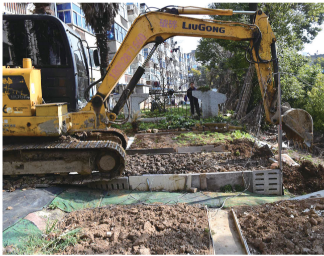
今年初，正东路街道江科大社区联合街道综合执法局对辖区毁绿种菜行为进行集中整治，共清理菜地约4000平方米，还绿给居民。

管好一个小区，是一项系统工程，不是哪一方的事，也不是哪一个人的事。不仅需要物业管理方尽心尽责“站好岗”，也需要基层社区组织、居民积极参与。社区等基层组织可以有效发挥党建引领基层治理的优势作用，充分调动小区居民的积极性，让大家有主人翁的意识，遇到矛盾和问题时群策群力，在全局中起到积极作用，共同为管好自己美丽家园尽到自己的责任。