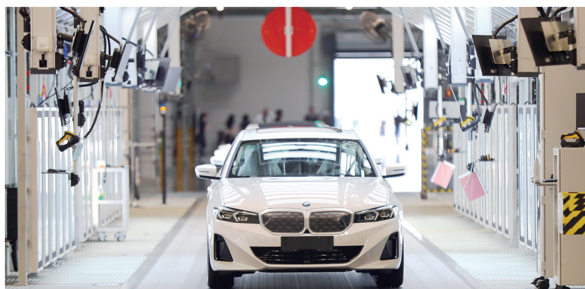
在华晨宝马里达工厂拍摄的BMW i3汽车(2022年6月23日摄)。