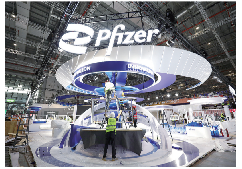
工作人员在国家会展中心(上海)内部布展施工(10月29日摄)。