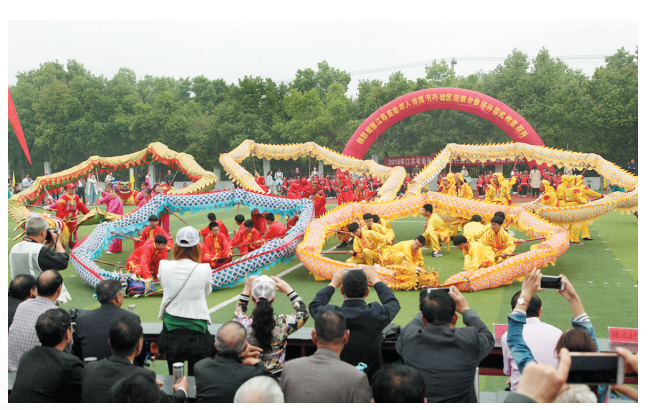
江苏省老年人体育节开幕式