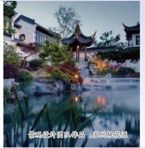
景观设计团队作品：苏州桃花源