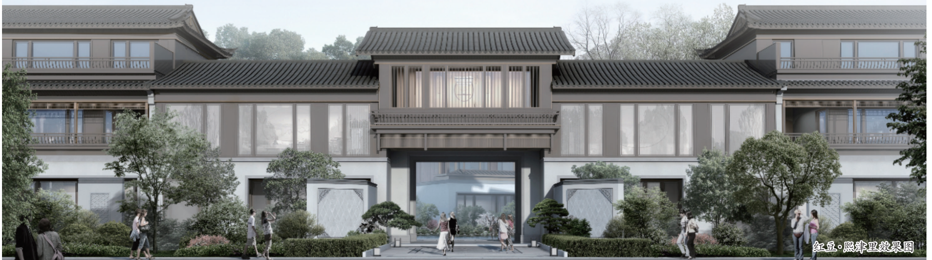
红豆·熙津里效果图