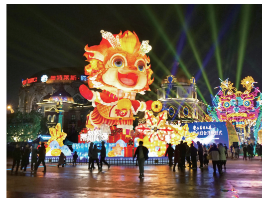
日前,2024江苏常州灯会启幕。七大特色主灯,数百组花灯装置,以科技与文化之美,点亮幸福常州。 常州