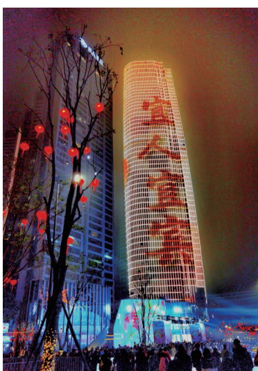
长江首城,宜人宜宾。摄于2024年元旦之夜的四川宜宾市长江音悦街。宜宾 庄剑/摄(华为 P40 Pro+)