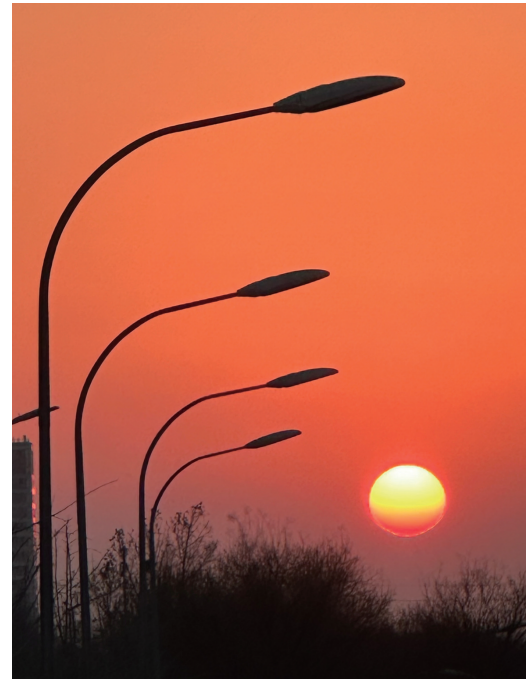
新年第五天。冬季的落日很美,像一盏大大的橘灯,为城市增光添彩。 北京