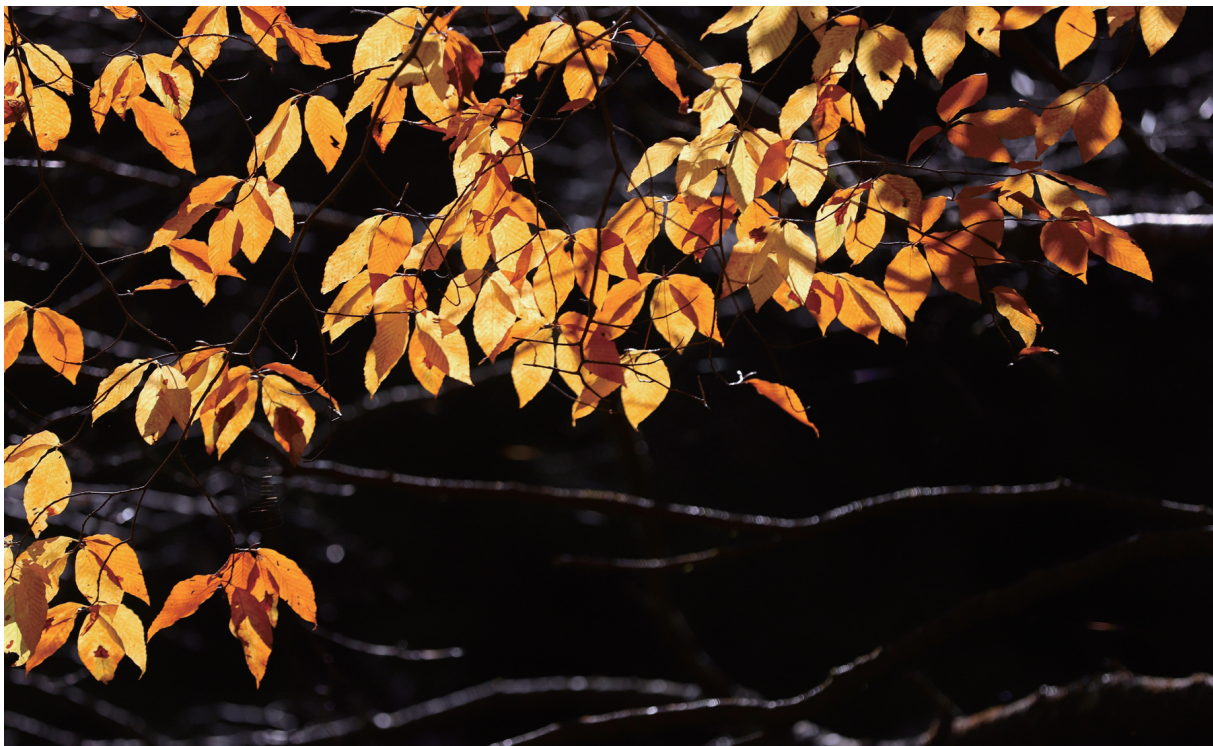
陕西宝鸡黄柏塬原生态风景区,橙黄色的树叶不惧严寒,在阳光下绽放出绚丽耀眼的光芒。