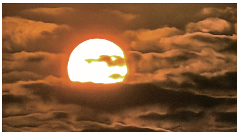
1月7日,双休日上早班,推窗见太阳,得“太阳公公”笑脸一枚,甚是惊喜。 厦门