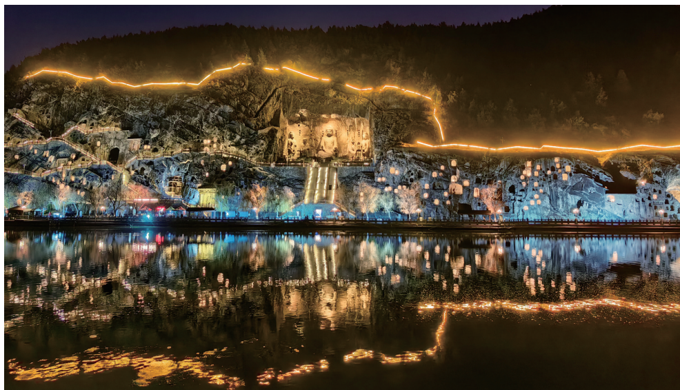
元旦,河南洛阳龙门石窟景区光影绚烂,人们夜游龙门,迎接新年到来。 洛阳 鲁博/摄(华为 Mate 50)