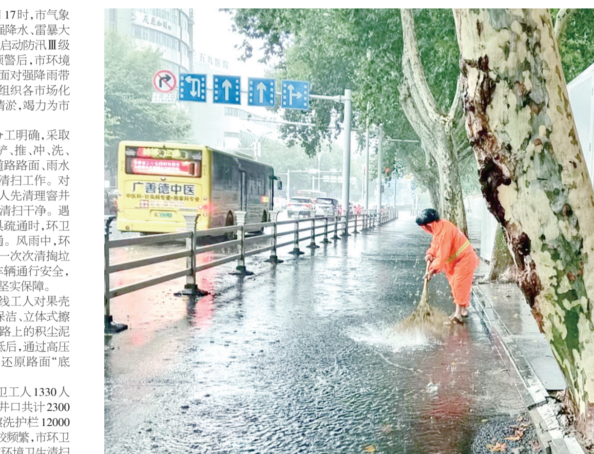
7月11日,保洁工人进行雨中排水清淤。

清理过程中,环卫工人抢抓时间,分工明确,采取机械与人工相结合的作业模式,运用“铲、推、冲、洗、扫”等作业方式,全面对主城区范围内道路路面、雨水井周边的淤泥、杂物、积水等,开展清淤清扫工作。对部分排水口堵塞导致积水路段,环卫工人先清理窰井盖上的杂物,让积水排放,再把周边垃圾清扫干净。遇到下水道被淤泥、树叶堵住,无法用工具疏通时,环卫工人弯下身子,徒手清淤,确保排水畅通。风雨中,环卫工人坚持着一趟趟弯腰寻找排水口,一次次清掏垃圾杂物,有力保障了暴雨天气的行人、车辆通行安全,他们以实际行动为城市安全度汛提供了坚实保障。 同时借助雨天“有利时机”,组织一线工人对果皮箱、垃圾桶和护栏进行全方位的精细化保洁,立体式擦洗,充分发挥机械清洗作业优势,雨天道路上的积尘泥土经过雨水浸泡,变得松软且附着力降低后,通过高压水车进行路面冲洗,易彻底清除顽渍,还原路面“底色”,达到事半功倍的效果。 据悉,此次排水清淤作业共出动环卫工人1330人次,机械化车辆11辆,共清理窰井点、窰井口共计2300余个,清洗果皮箱、垃圾桶1150余只,擦洗护栏12000米。预计未来一段时间降水天气仍会比较频繁,市环卫中心将密切关注天气状况,及时做好城市环境卫生清扫保洁工作,维护优美市容环境,保障市民安全出行。