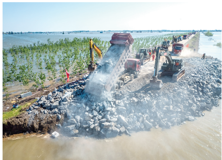
湖南华容洞庭湖决堤现场

其中,预拨湖南、安徽、江西、黑龙江、江苏、浙江、湖北、重庆、贵州9省(市)洪涝及地质灾害救灾补助资金5.03亿元,重点用于搜救转移安置受灾人员、排危除险等应急处置、开展次生灾害隐患排查、倒塌民房修复等工作;预拨内蒙古、山西2省(区)森林火灾救灾补助资金0.37亿元,重点用于应急抢险救援。