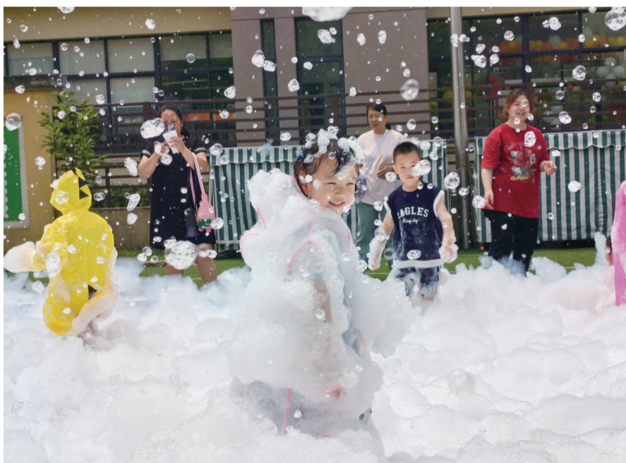
共赴一场 “雪王国”游园派对

近日,扬中市滨江幼儿园举办了“雪王国”游园派对暨学前教育宣传月主题活动,与家长共同见证孩子们的健康成长与欢乐时光。