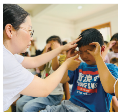
“睛”心呵护 美好“视”界

心之所“暑”,“益”起精彩。2024年市少年宫教学部精心安排的免费公益课程多达30门,面向全市少年儿童提供便利、优质、多元化、多层次的素质教育服务。暑期公益课程惠及全市少年儿童,既彰显少年宫的公益普惠性特色,更给每个孩子提供筑梦的舞台,使孩子们真正实现快乐学习、全面发展、健康成长。