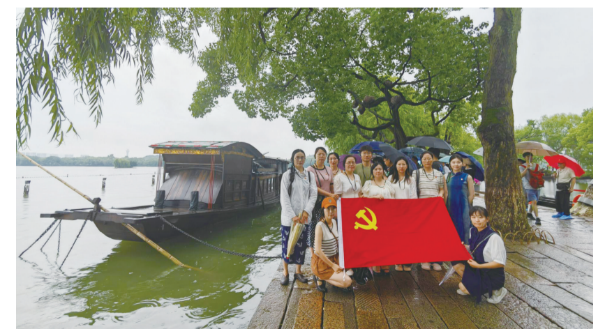
传承红色基因 筑牢自律底线

下一阶段,句容将发动社会各界力量,以丰富多彩的夏日活动为载体,依托文博场馆、爱国主义教育基地、红色旅游资源,广泛开展社会主义核心价值观宣传教育、阅读分享、艺术欣赏、红色寻访、劳动教育、关爱帮扶、志愿服务等形式新颖、贴近实际、内容鲜活的系列活动,有效引导广大青少年进一步开阔视野、陶冶情操、强健体魄,快乐成长。