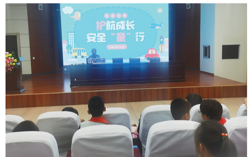
快乐过暑假 安全不“放假”

为确保校园安全无死角,全市各学校对消防安全、食品安全、实验室危化品安全、校园及周边环境安全、交通安全等方面进行了全面排查。对于发现的问题,各校立即整改,确保隐患得到及时消除。此外,各校还加强了对宿舍及一键报警等安全设施的检查和维修,确保在紧急情况下能够迅速响应。