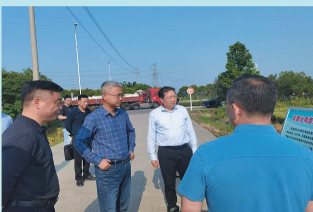
南京督察局领导调研我市例行督察发现问题整改情况。