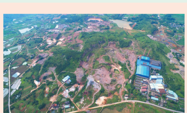
句容市白兔镇上荣村工矿废弃地复垦项目整治复垦前。