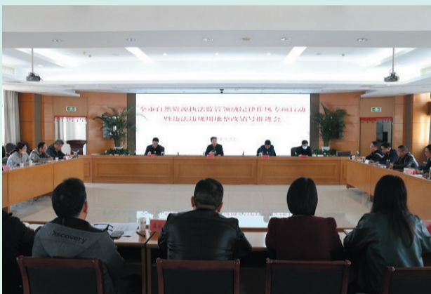
市自然资源和规划局召开会议部署推进违法违规用地整改销号。