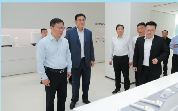
省自然资源厅党组书记、厅长张国梁走进丹阳市开发区，调研开发区节约集约用地。