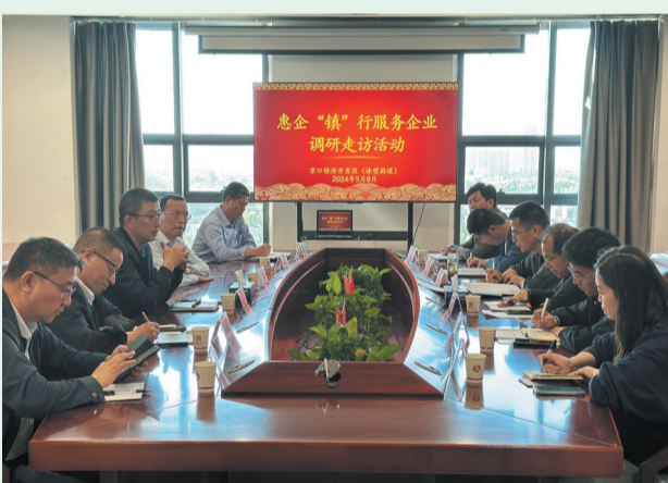
惠企镇行服务企业调研活动座谈会。