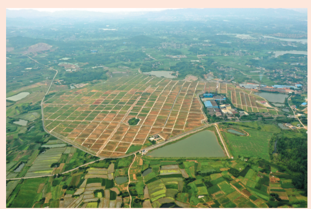
句容市白兔镇上荣村工矿废弃地复垦项目整治复垦后。

2024年6月25日是第34个全国土地日，活动主题是“节约集约用地 严守耕地红线”。