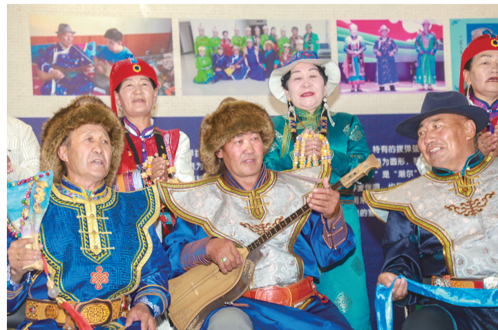
艺人弹奏可克达拉托布秀尔演唱新疆非遗《江格尔》。