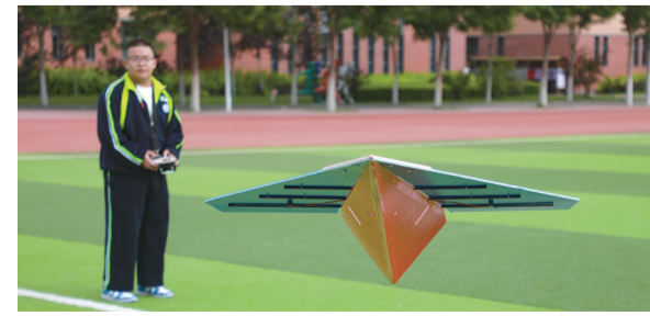
可克达拉市镇江高级中学学生航模表演。