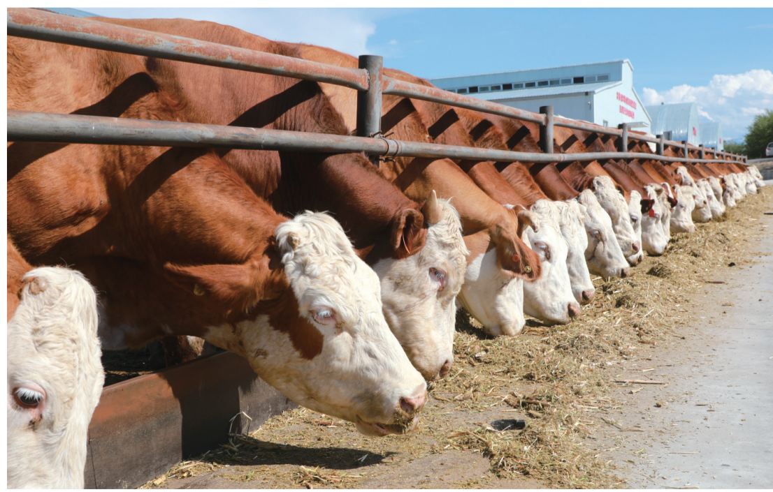
可克达拉市洪海牧业有限公司养殖场。