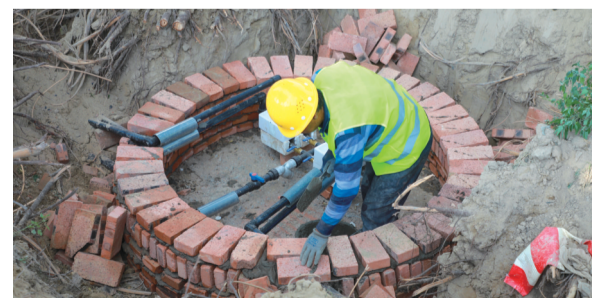
七十六团人居环境安全饮水工程建设中。