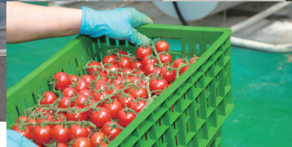
润泰智慧农业产业园新鲜采摘的串收番茄。