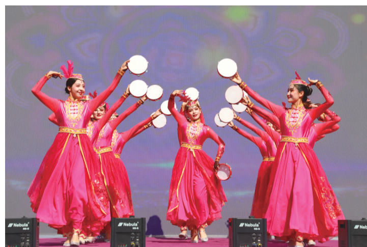
伊帕尔汗薰衣草文化产业园内民族舞蹈表演。