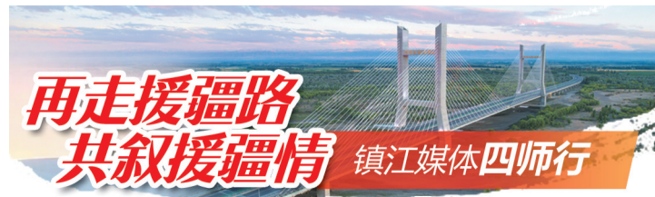
再走援疆路 共叙援疆情 镇江媒体四师行