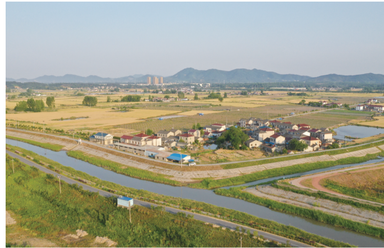
市级河道便民河与镇级河道东山河的交汇点。