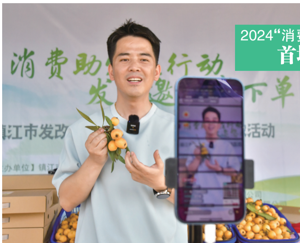
2024“消费助农在行动”首场告捷

值得一提的是，今年，地产枇杷的网销模式提升明显。一位枇杷种植户表示，这一季枇杷销售，网销外地的枇杷占总销量的30%以上。