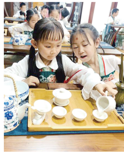
茶润童心 以茶习礼

日前,句容市图书馆组织开展了“茶润童心,以茶习礼”少儿茶艺公益课,普及推广少儿茶艺,弘扬中国传统文化。公益课以茶艺礼仪作为切入点,结合实物、故事介绍了茶的起源、茶的种类、茶的礼仪等知识,让孩子们对茶文化有了初步认识。