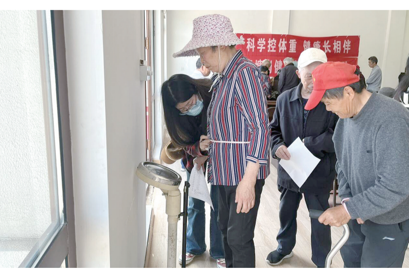
科学控体重 健康长相伴

日前,句容市黄梅社区卫生服务中心举办了“世界家庭医生日”系列宣传活动,通过开展老年人健康体检、举办现场家庭医生义诊咨询等个性化健康服务,进一步加大签约服务的覆盖面。