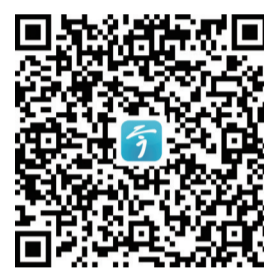
视频制作 胡冰心 孙力 卞婷婷

每个人的记忆中都有一条街巷,静默诉说岁月的流转,默默彰显着城市的底蕴。老巷的烟火气和浓浓的文化味如何融为一体?位于金山街道银山门社区的万家巷正在做出一些探索:对老街巷综合改造提升,让一条极具历史文化、市井烟火气的老街巷焕发新活力。 万家巷南接大龙巷,北至大西路,南北走向,长281米,宽约3米。清光绪《丹徒县志》记载有万家巷。相传清乾隆年间,有一姓商人在巷口开设铜锡店,小巷因其姓氏而得名。清代有地名联句“石婆婆劈竹竿万家捶桶”概括镇江巷子的名称,其中“万家”就是万家巷。 行走在万家巷里,清幽的古意夹着鲜活的烟火气,唤起你对老城市井的眷恋。巷子虽然不长,却保存着近10座老式民居。它们仿佛在诉说光阴的故事。万家巷62号小院,韩大龙和妻子居住在此。“小时候万家巷可热闹了,每家院子里都住着不少人!”说起童年趣事,韩大龙的话匣子一下就打开了。小时候一到夏天,每家每户就搬躺椅、床一起上街纳凉。“自行车想穿过巷子都难,因为人太多了,根本走不动!” 韩大龙有个“特殊”的身份——中国当代小说家、散文家、戏剧家汪曾祺先生的亲外甥。他告诉记者,母亲汪巧纹是汪曾祺的大姐。汪曾祺一直敬重、关心大姐。上世纪70年代,汪曾祺来镇江,特地来万家巷看大姐,挥毫相赠一副对联“笙歌一望江 烟火万家巷”。有关万家巷的故事还有不少。“两弹一星”元勋郭永怀的夫人李佩的祖居也在万家巷内。1932年10月创刊的《东南晨报》,社址同样在万家巷。 修旧如旧,老巷更新。如今,走进万家巷,巷道宽阔整洁,巷内花坛中绿意葱茏,沿巷房屋经过修缮粉刷景象一新。那么,如何利用好“老巷巷”历史文化资源? 银山门社区党委书记蒋菊华介绍,社区正依托慈善文化打造“古善新风街”,而万家巷是连接大西路和“古善新风街”的一条重要文化长廊,希望能够打造好这条示范街巷,将西津渡、镇江博物馆等景点连成一片,吸引更多市民游客前来游玩打卡。“目前万家巷的道路修整好了,接下来将美化街区环境,深入挖掘万家巷的历史文化,让老巷在新时代焕发出蓬勃生机。”