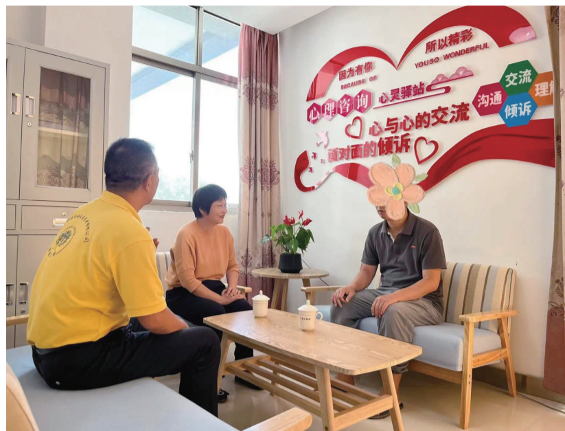
图为志愿者正在与服务对象交流。