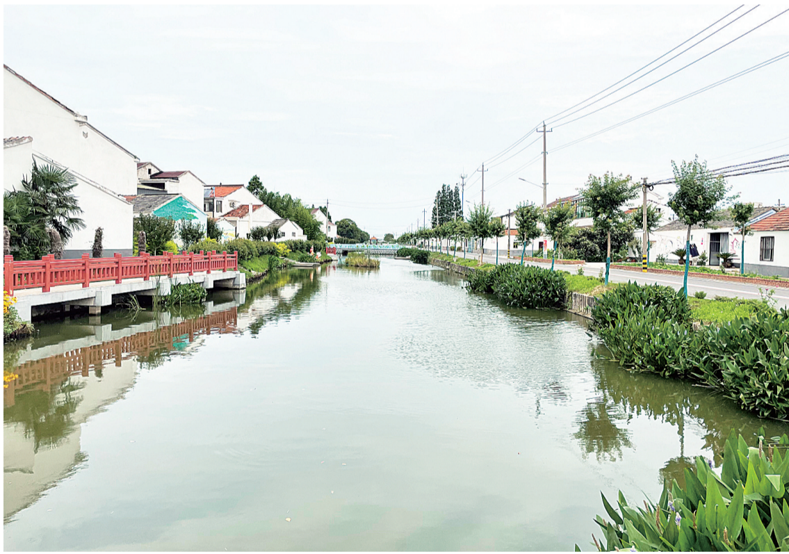
云阳街道睦巷长沟。