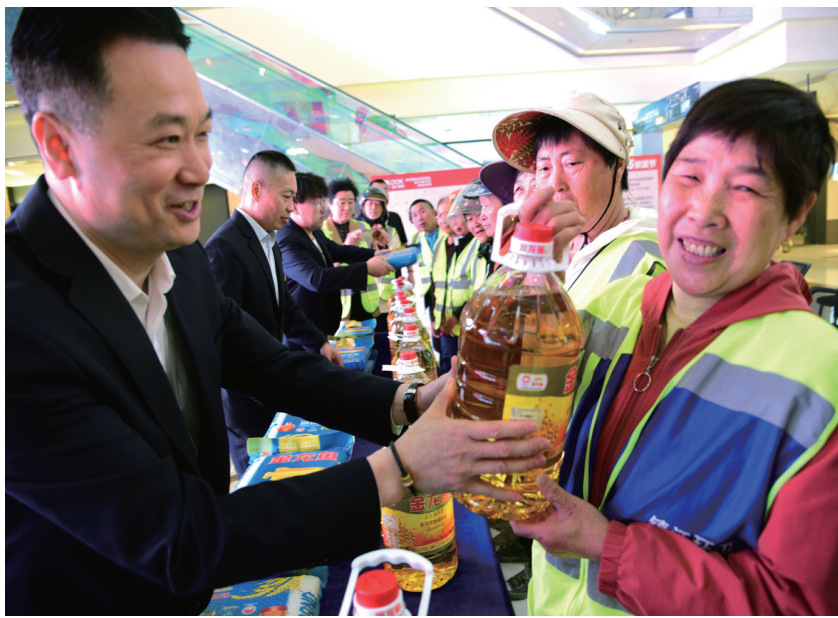
致敬劳动者 关爱环卫工 日前,七里甸街道金星社区联合辖区爱心企业开展“致敬劳动者 关爱环卫工”活动,向环卫工人赠送大米、食用油等慰问品,活动向多名环卫工人送上爱心关怀。

本报讯(曹文钦)近日,金山街道杨家门社区联合中国人寿寿康分公司,组织辖区各族居民开展“心随心动 一路‘艾’你”母亲节主题活动。 活动中,社区邀请手工艺老师教大家制作精美的回族人艾草养生锤,同时倾听她们的心声,和大家一起分享身边的母爱瞬间。制作完成自己的“艾草锤”和“民族头巾”,大家相互展示作品,并用艾草锤敲打着肩膀、后背、关节等部位,场面温馨满满。