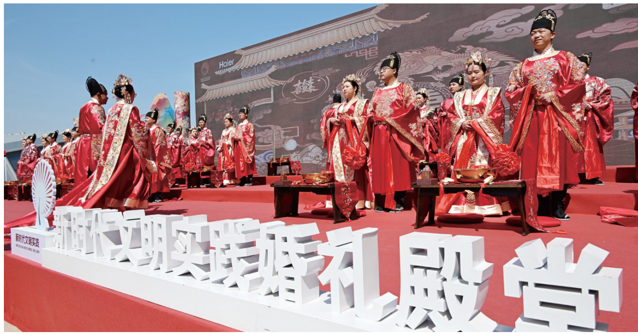
5月9日,在青岛市崂山区海尔路生态园新时代文明实践广场,新人在集体婚礼上。

当日,“智慧家·爱永恒”2024年青岛市新时代文明实践集体婚礼在山东省青岛市崂山区举行,30对新人身着传统婚典服饰,共同许下誓言。