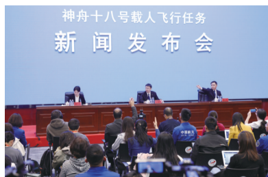
4月24日，神舟十八号载人飞行任务新闻发布会在酒泉卫星发射中心举行。

航天作为当今世界最具挑战性和广泛带动性的高科技领域之一，以其所蕴含的科学精神，始终激励人们不断探索未知。从“两弹一星”，到“嫦娥”揽月、“祝融”探火、“天宫”遨游星辰，中国航天60多年来始终逐梦星辰大海，成绩举世瞩目。展望未来，豪情满怀。