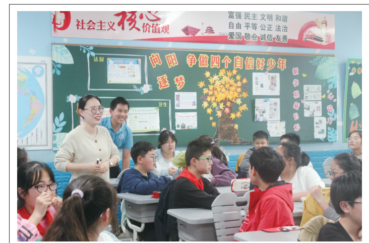
市实验小学结合《家庭教育促进法》开发了《家长课程》,组织家长们走进课堂,发挥自身潜质和优势向孩子们分享自己的成功与精彩。日前,六(8)班家长课堂邀请家长给孩子们分享了一节生动的绘本阅读课。

与冯夫人相似的还有南宋士大夫楼钥的母亲汪夫人,“庄重有家法”“教子甚严”,也是宋代严母的典范。