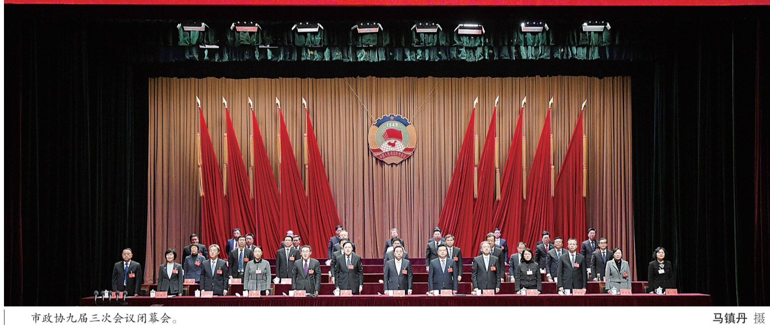
市政协九届三次会议闭幕会。