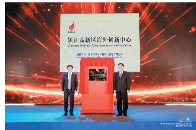
镇江高新区海外创新中心揭牌