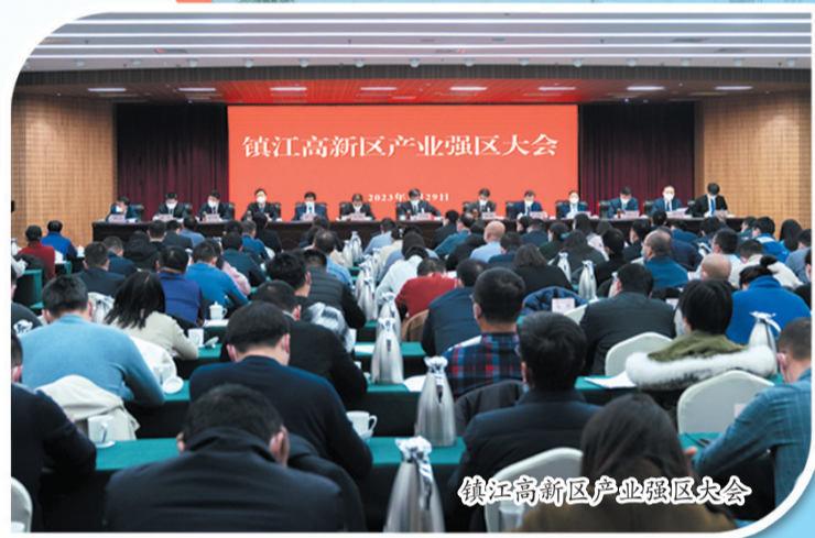
镇江高新区产业强区大会

2024年是全面完成“十四五”规划目标任务的关键一年，更是交出习近平总书记视察镇江十周年答卷的大考之年，镇江高新区将更大力度实施产业强区战略，更大力度推进创新驱动发展，更大力度推进产城融合发展，更大力度夯实发展保障，奋力展现“走在前、做示范”的新气象新成效，在新征程上全面推进中国式现代化高新区新实践取得更大突破。