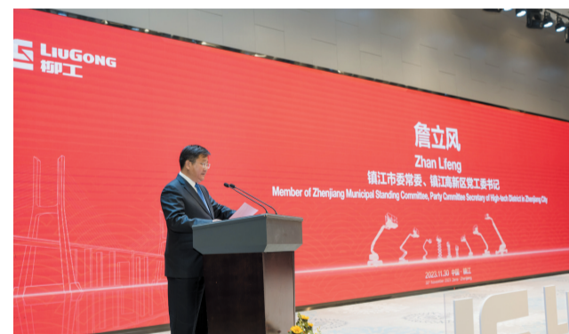
柳工举行成立二十周年暨高机新产品发布会