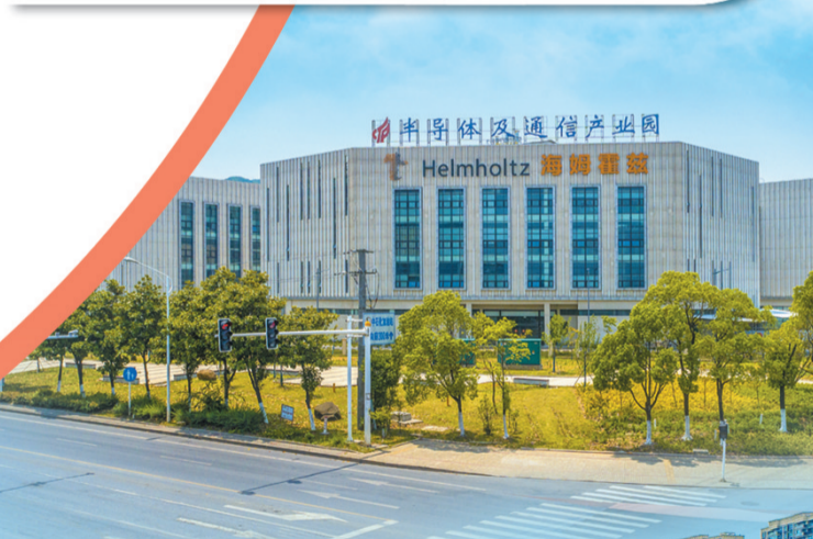
海姆霍兹海工装备