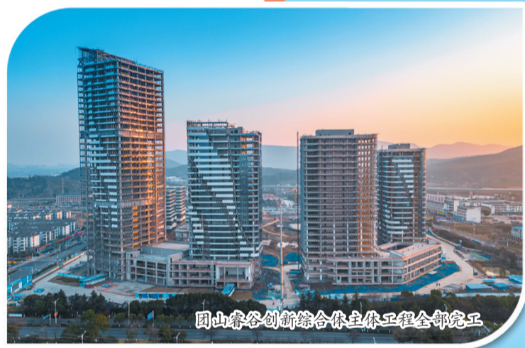
团山睿谷创新综合体主体工程全部完工