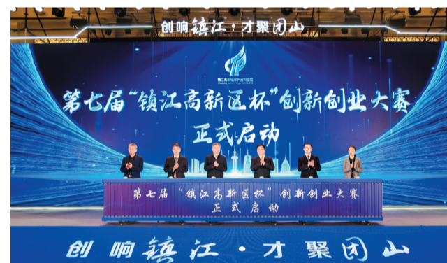
第七届“镇江高新区杯”创新创业大赛启动仪式