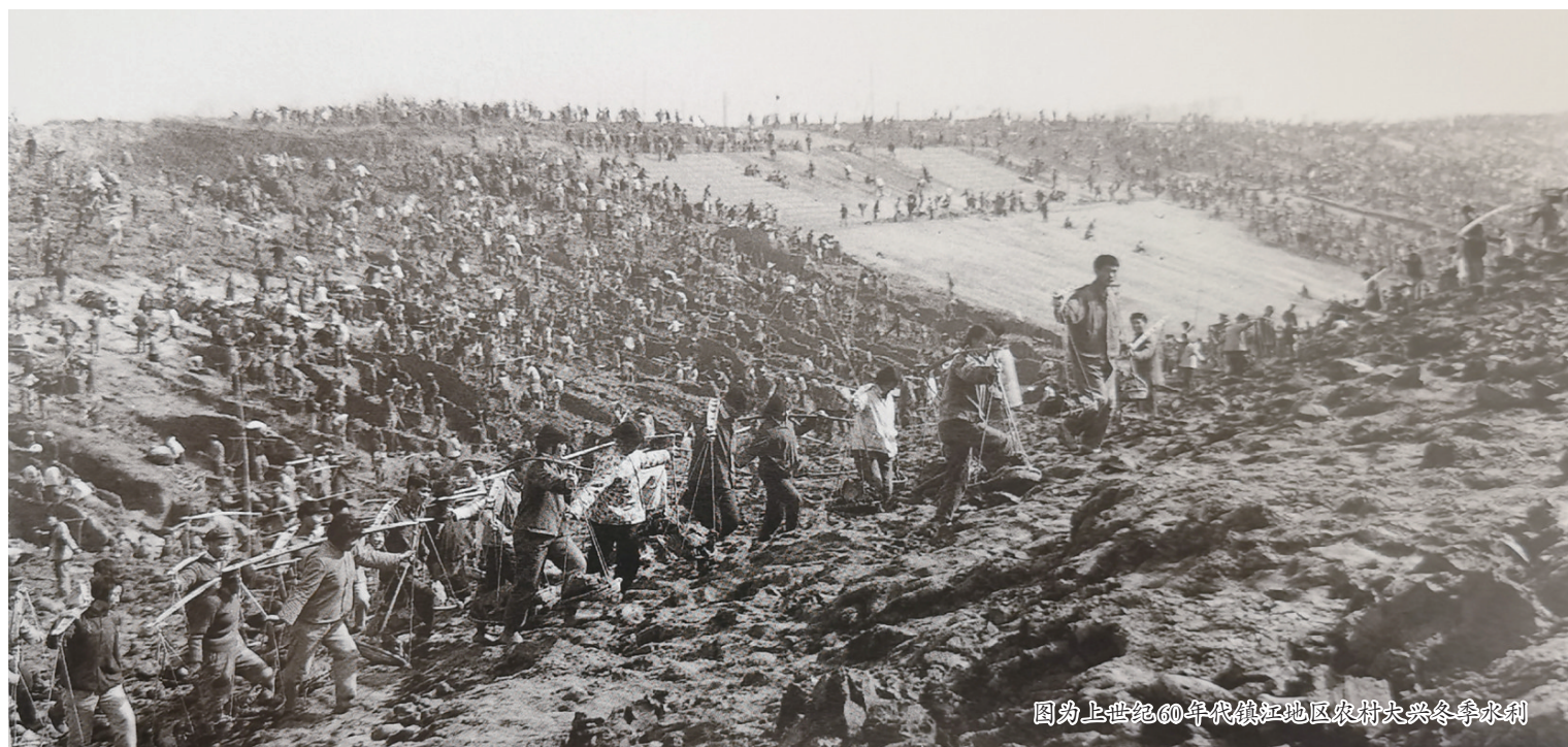
图为上世纪60年代镇江地区农村大跃进冬修水利