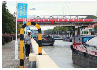
体验日活动现场。

下午2:30，在谏壁船闸临时运营中心，工作人员正通过水上通航智慧监管平台实时保障上下游航道的畅通。自京杭运河苏南段航道“三改二”暨谏壁一线船闸扩容改造工程开工以来，市港航部门把边通航边施工作为重要工作来抓，提前谋划好通航方案，有效解决了停航施工带来的单闸运行压力。“坐在房间里，运河通行情况就能一目了然，太神奇了。”（下转2版）