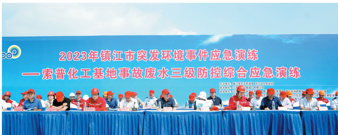
2023年镇江市突发环境事件应急演练 — 索普化工基地事故废水三级防控综合应急演练