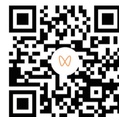
“码”上看镇报小记者精彩表现