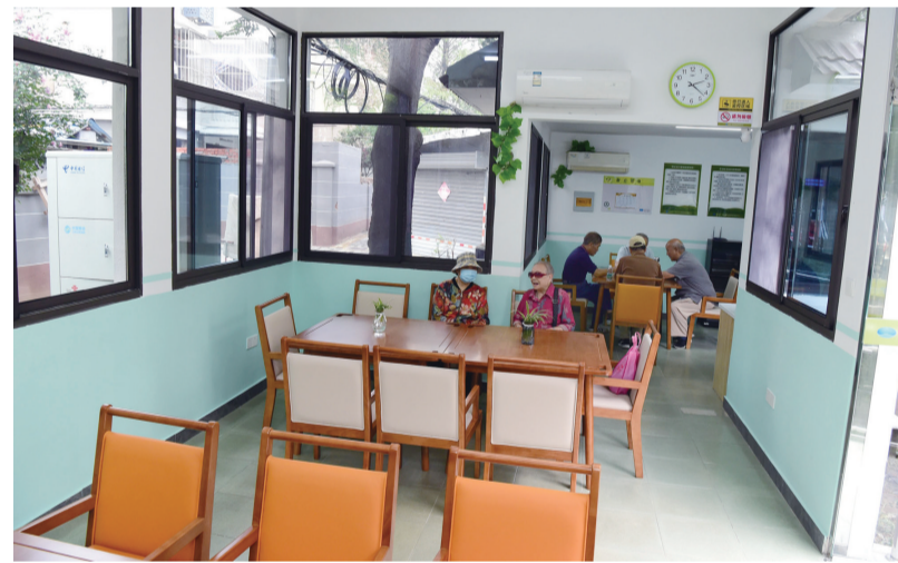
9月26日，京口区健康路街道尚友社区居家养老服务中心启用运营，这是健康路街道又一民生实事项目。街道与吴中集团旗下的瑞颐康养携手合作，将尚友新村办公用房改造成嵌入式居家养老服务中心，设置助餐区、活动室、书画室等多个功能区域。

居民破解“做饭难”“吃饭愁”的难题。这些紧贴日常的惠民举措就能实现他们的“老有所依”。 不仅于线下，涉及线上办理业务的场景中，对老年群体的适老化个性化服务更应跟上。近年来，有关民政、医疗、金融等领域的适老化改造已在不断推进，有关部门单位应结合最新政策和实时情况，做好适老化服务，常更新常新，把便利的服务做进老年群体的心坎里，让他们在每次接受服务时都有获得感、幸福感。