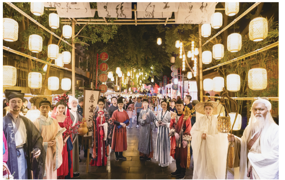
在成都宽窄巷子新“十二月市”街区，装扮成唐宋时代人物形象的演员欢迎游人(9月29日报)。

用于长效治上来，绵绵用力、久久为功。真创建，真解决问题，确保群众真满意，说到底就是要坚决防止文明城市创建中的形式主义、官僚主义问题，坚持以人民群众的立场抓好创建工作，把文明创建与解决群众需求紧密结合起来，不断提升城市治理水平，以实实在在的成效赢得群众的广泛认可和支持。 当前，全国文明城市年度测评即将展开。时间不等人，任务不等人，全市各级必须紧扣既定目标任务，增强“时时放心不下”的责任感和“事事落实到位”的执行力，转变工作思维，注重创建实效，全力以赴交出全国文明城市创建的精彩答卷。