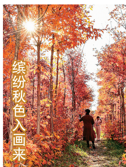
10月19日，游人在长春市百木园内拍摄秋景。金秋时节，吉林省长春市秋意浓郁，景色如画。

访问期间，中科双方将开展互访拜会、互相参观、甲板招待会、军事交流、文体联谊等多项活动。