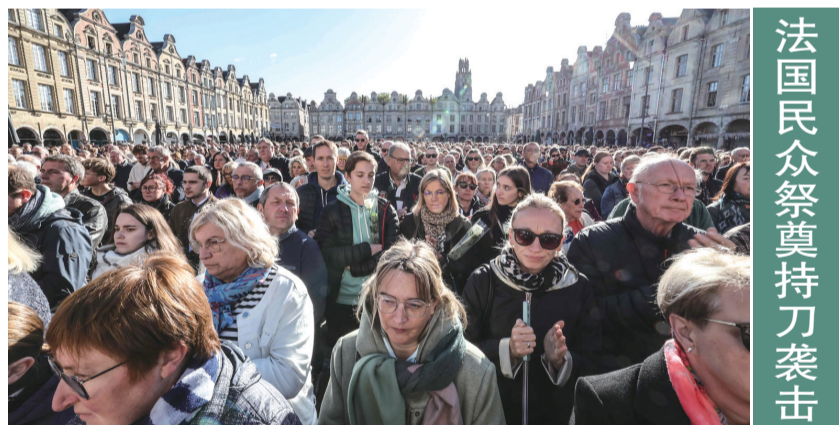
法国民众祭奠持刀袭击遇难者

E组比赛中，波兰队主场1:1战平摩尔多瓦队；捷克队主场1:0战胜法罗群岛队，暂居小组第二。1组罗马尼亚队主场4:0击败安道尔队，以16分领跑小组。瑞士队主场3:3战平白俄罗斯队，以15分位居小组次席。科索沃队与以色列队的比赛延期举行。