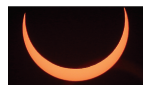
日食出现在洪都拉斯首都特古西加尔巴上空。

美国媒体报道称，该航母打击群13日从弗吉尼亚州启程，在抵达部署地点后不会参与以色列在加沙等地的军事行动。