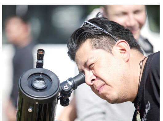
10月14日，一名男子在墨西哥首都墨西哥城观看日食。

今年第二次也是最后一次日食景象于北京时间10月14日晚至15日凌晨现身天宇。本次日食是一次日环食，环食带从太平洋东北部开始，向东南方向延伸，会经过美国、墨西哥、洪都拉斯、尼加拉瓜、巴拿马、哥伦比亚、巴西等国，最后在巴西东部的大西洋洋面上结束。