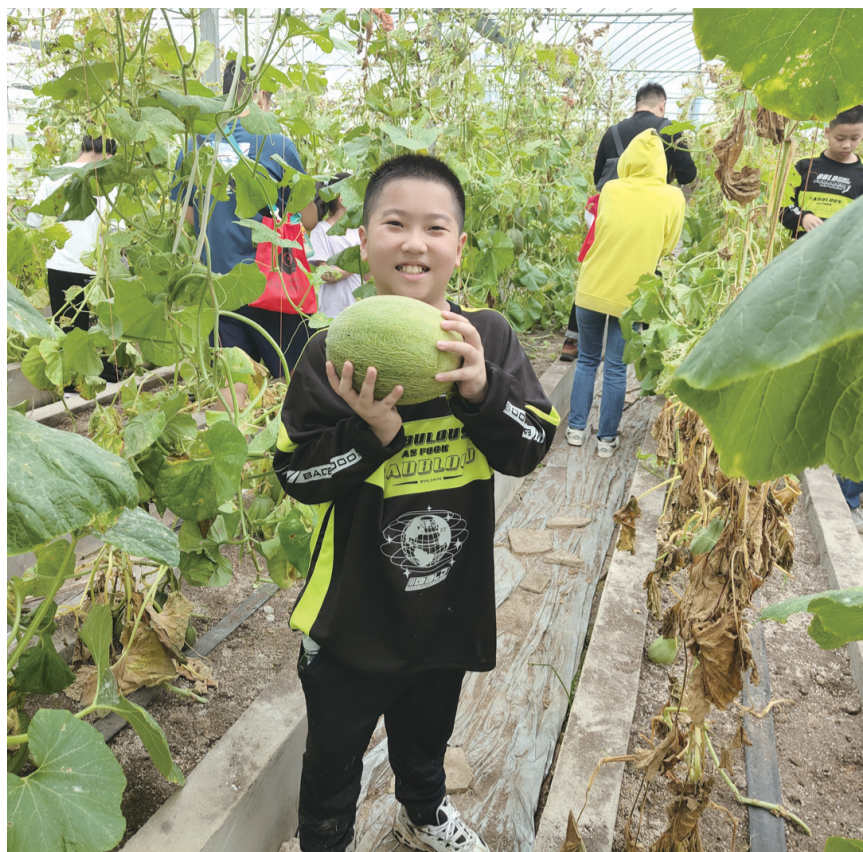
在嗨皮小猪农场采摘网纹瓜