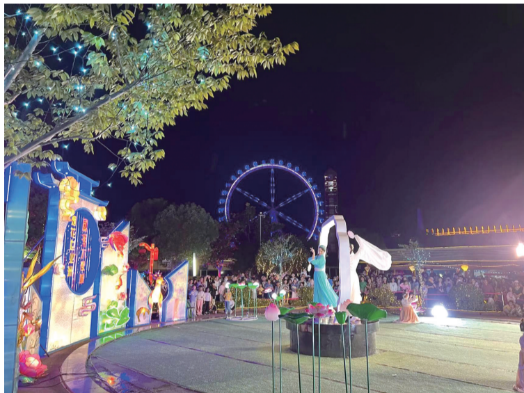
开心休博园国风表演