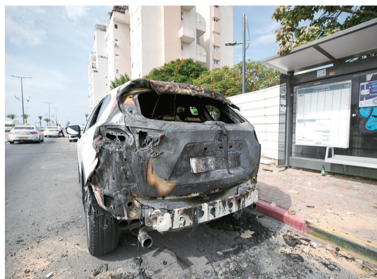
10月9日,在以色列南部城市阿什凯隆,一辆汽车遭到火箭弹破坏。

9日早些时候,以军发表声明说,以军出动直升机对黎巴嫩南部部分地区实施空袭,此外以军还打死多名从黎巴嫩越境进入以方区域的武装人员。