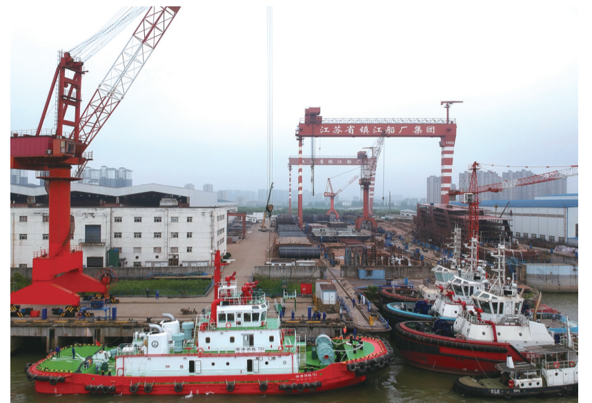
国内最大的特种船舶制造基地。

该市优化营商环境，全力保障产业链供应链循环畅通，助力企业增产增效。丹阳市副市长李培博介绍，今年上半年，丹阳营商环境满意度评价位列镇江第一，大健康、汽车零部件产业规模分别增长36.9%、21.8%。项目攻坚态势不断深化，产业发展质