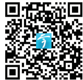
一码上看现场 视频制作 张子杰

聚焦“项目攻坚突破年”，各地、各部门正持续吹响产业强市“行动号角”，不断推进重大项目建设，培育标杆企业，壮大产业链群，升级重要载体，努力构建现代化产业体系，在强链补链延链上奋力展现新作为。