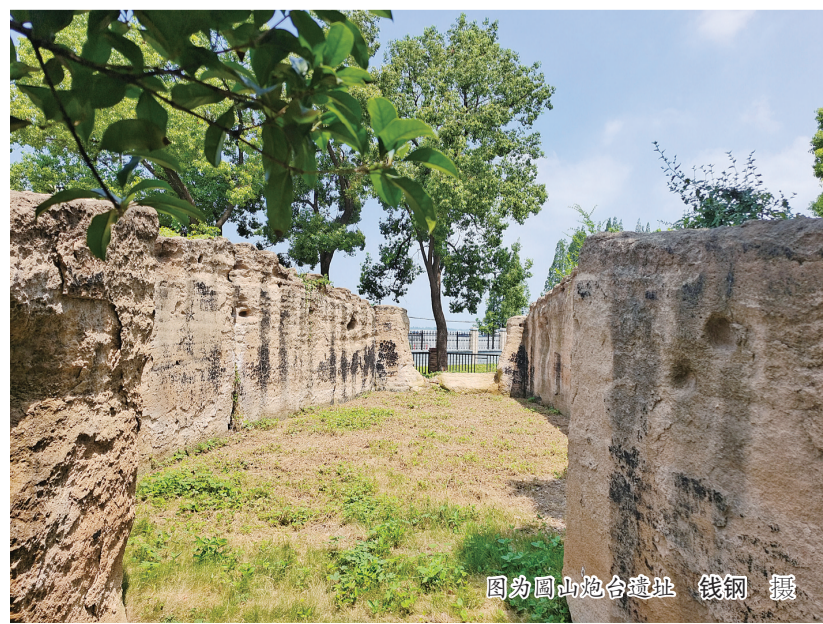
图为圆山炮台遗址

奋斗精神落实到推动新区高质量发展的实际行动中。今年以来，镇江新区以打造“红色‘宜’地”理论宣教品牌为抓手，广泛开展革命传统和爱国主义教育“进企业”“进社区”“进网站”工作，累计组织近千名党员群众就近就近到中共镇江地方史馆、赵伯先故居等爱国主义教育基地参观学习。下一步，新区宣传统战部将依托现有基础，全面启动镇江圆山炮台遗址申报省级爱国主义教育基地各项工作，进一步丰富镇江新区革命历史文化内涵，久久为功不断扩大“红色‘宜’地”理论宣教品牌影响力。