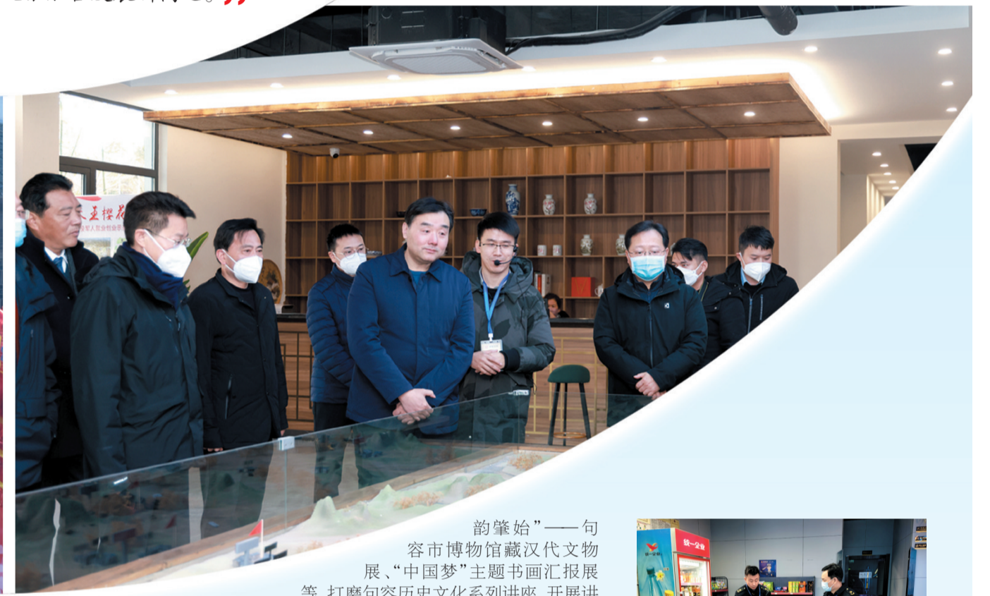
韵肇始”——句容市博物馆藏汉代文物展、“中国梦”主题画汇报展等，打磨句容历史文化系列讲座，开展讲座5场。召开句容市文物行业重大事故隐患排查专题会议，签订文博单位责任书。开展陶器文物抢救性保护修复，推进文保单位及“三普”文物点日常安全巡查。宝华山隆昌寺消防工程通过省局验收，上报春城土墩墓群本体保护工程及隆昌寺修缮工程项目计划书。