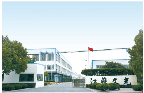
江苏文光集团外景