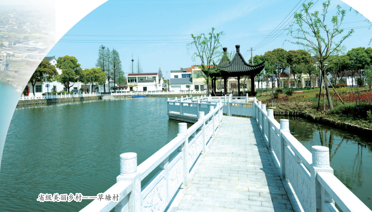
省级美丽乡村——羊塘村