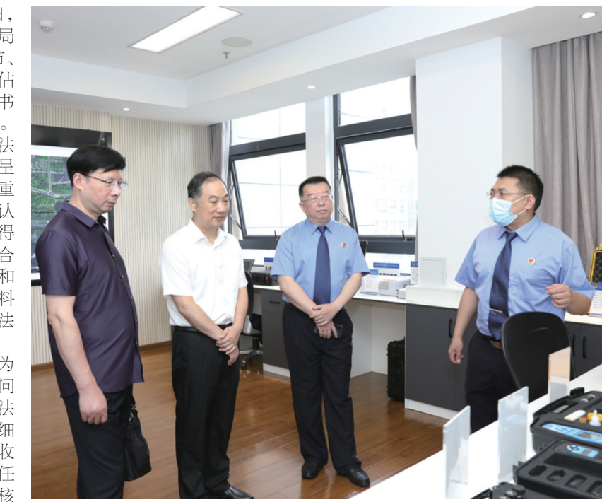
评估验收组来到市检察院实地评估验收。

市普法办将以此次中期评估工作为契机,针对此次中期评估验收中存在的问题和考核组的反馈意见,对照《江苏省法治宣传教育第八个五年规划实施评估细则》,形成全市“八五”普法中期评估验收自查报告和情况通报,进一步明确目标任务,确保在国家级、省级“八五”中期考核验收中基础指标不失分,附加指标争加分,综合考核得高分。