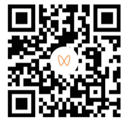
视频制作:茅以升精神”

如今的镇江已成为一片蓬勃发展的热土,一代又一代镇江人承载着茅以升的“精神之桥”,为镇江的美好明天搭起一座“发展之桥”!