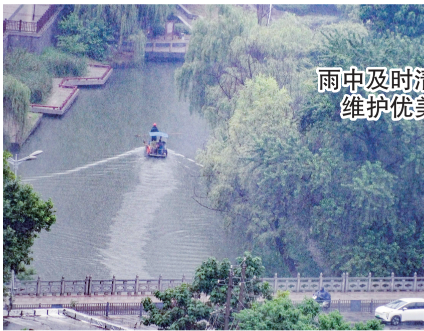
雨中及时清理漂浮物 维护优美水环境

“南山街道党工委将继续做好阅读空间的优化、创新,持续做好书籍的管理、维护,及时增添更新书籍种类,完善服务质量,朝着‘让读书成为生活态度’的方向不断努力。”南山街道相关负责人说。