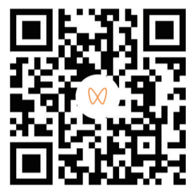
扫码观看精彩视频