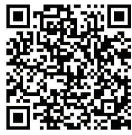
扫二维码报名参赛

快来扫描二维码,观看镇报小记者“飞花争霸赛”第二期的精彩视频吧!你还知道哪些与荷花有关的诗词,欢迎在评论区和我们留言互动。如果你是镇报小记者,欢迎积极报名参加活动。“飞花争霸赛”,我们在等你哦!