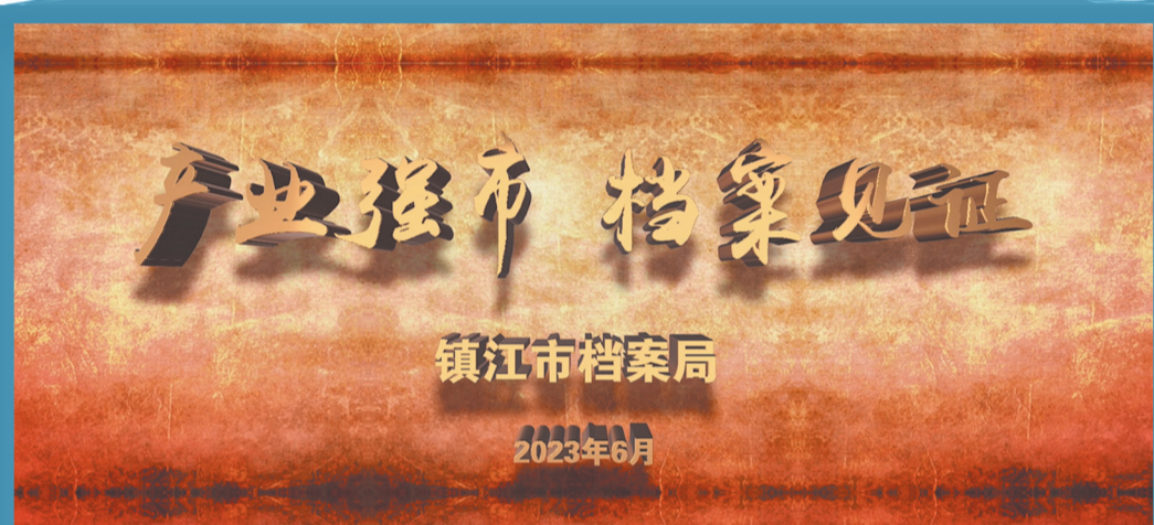
“产业强市 档案见证”专题片

2023年6月9日是第16个国际档案日，主题为“奋进新征程 兰台谱新篇”。为进一步提振“四敢”精气神，助力产业强市战略，优化营商环境，市委办公室（市档案局）牵头，举办“产业强市 档案见证”系列宣传活动，通过重要节点、重要人物、重大布局、重点项目，串联了撤地设市40年来镇江的产业发展史，从乡镇企业的万千细流，到外向型经济的澎湃之势，从优化调整的创新航程，到转型升级的全新赛道，镇江产业发展持续迸发强劲活力，为高质量发展注入信心动力。系列宣传活动包括“十个一”：一堂授课、一个展览、一本画册、一部专题片、一次档案捐赠、一场档案知识答题、一批档案开放、一场巡展、一次主题征文、一期专刊。