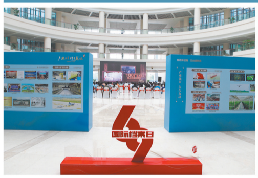
举办“6·9”国际档案日系列宣传活动。