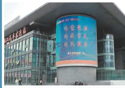
全市户外大屏广泛宣传档案标语