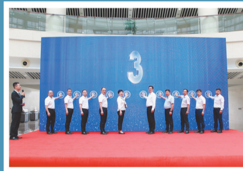
第16个“6·9”国际档案日系列宣传暨巡展活动正式启动。