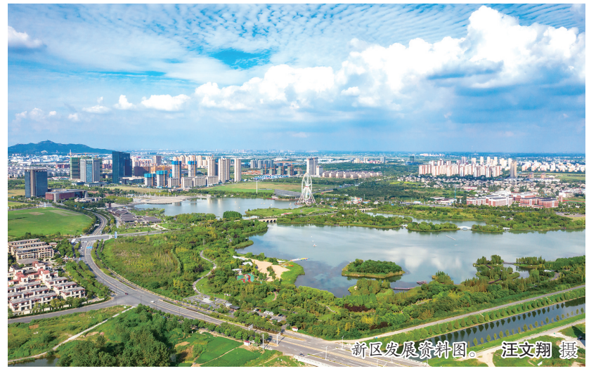
新区发展实景图

会上,新区经发委通报1-4月份主要经济指标完成情况,汇报上半年指标预计完成情况。科信局、财政局、开发区税务局、瀚瑞控股、人社局、城乡建设局、招商中心等经济相关部门以及各镇(街道)、园区分别作工作汇报和表态发言。