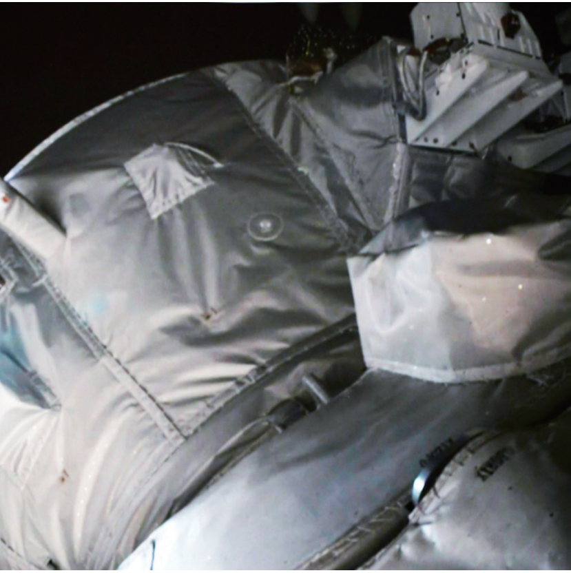
天舟六号货运飞船与空间站组合体完成交会对接

5月11日在北京航天飞行控制中心拍摄的天舟六号货运飞船与空间站组合体完成交会对接的画面。