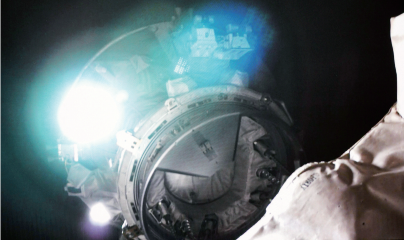
5月11日在北京航天飞行控制中心拍摄的天舟六号货运飞船与空间站组合体完成交会对接的模拟图像。 新华社发

5月11日在北京航天飞行控制中心拍摄的天舟六号货运飞船与空间站组合体完成交会对接的画面。 新华社发