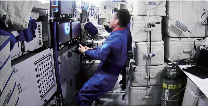
5月11日在北京航天飞行控制中心拍摄的天舟六号货运飞船与空间站组合体完成交会对接后天和核心舱内的画面。

新华社北京5月11日电 据中国载人航天工程办公室消息，天舟六号货运飞船入轨后顺利完成状态设置，于北京时间2023年5月11日5时16分，成功对接于空间站天和核心舱后向端口。交会对接完成后，天舟六号将转入组合体飞行阶段。 后续，神舟十五号航天员乘组将进入天舟六号货运飞船，按计划开展货物转运等相关工作。