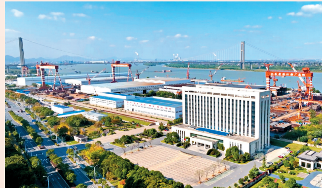
2023年，市工商联副主席单位镇江船厂坐落润扬大桥东侧厂区全景

镇江地处长江和运河交汇处，拥有3000多年历史，自古为水陆要冲，交通便利，漕运发达，商贾云集，文化底蕴深厚。清末至民国时期，镇江已成为通商大埠，工商实业、金融业、水电业等诸业兴旺，商会、同业公会、工商自卫团等各种团体组织纷纷成立。