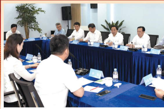
市委主要领导督办重点提案《关于发挥龙头企业牵引作用，提升产业链现代化水平》