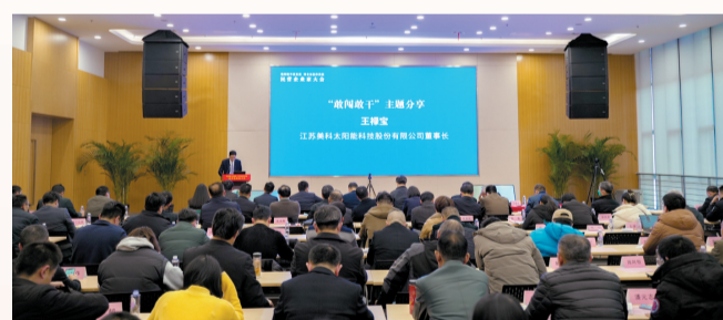
举办“敢闯敢干促发展 项目攻坚作贡献”民营企业企业家大会

70年来，镇江市工商联作为党和政府联系民营经济人士的桥梁纽带、政府管理和服务民营经济的助手，围绕“两个健康”主题，持续优化发展环境，促进民营经济发展壮大。2022年底，全市登记注册的个体经济42.24万户、私营企业13.06万户，占全部市场主体的96.21%；全市规模以上民营企业2034家，占全部的66.1%；全市12个年销售百亿以上企业、民营企业9家，4家跻身中国民营企业500强，7家跻身中国民营企业制造业500强；全市省级以上“专精特新”企业182家，民营企业占80%以上，民营高新技术企业1225家，占全市的91.5%。民营经济成为经济增长的重要动力、创新的重要主体、经济高质量发展不可或缺的重要力量。