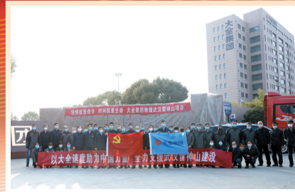
工商联系统及民营企业参与抗击新冠疫情行动

时光荏苒，岁月如歌。镇江市工商业联合会（简称镇江市工商联，又称镇江市总商会）自1953年4月成立至今，历经十三届，走过了七十年不平凡的发展历程。