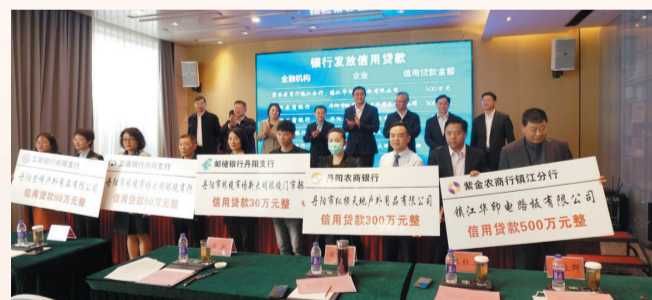
金融服务“甘露行动”