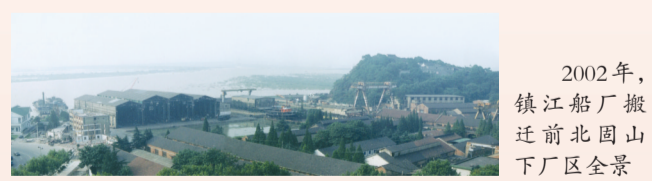
2002年，镇江船厂搬迁前北固山下厂区全景