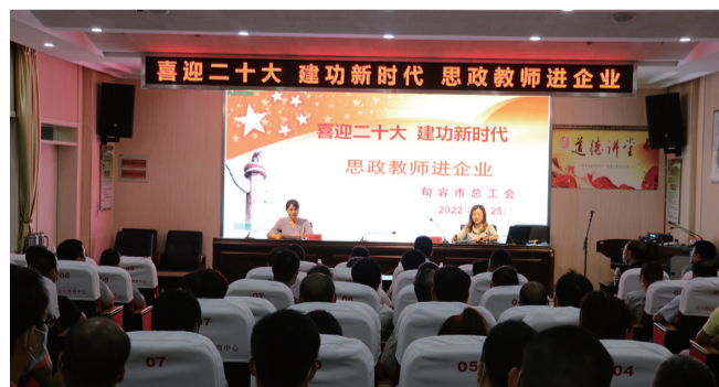
思政教师进企业宣讲