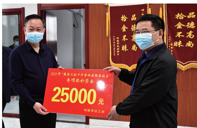
为最美户外劳动者服务站点发放补助