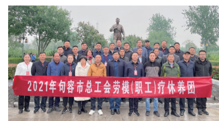
组织劳模职工疗休养

2023年是全面贯彻落实党的二十大精神的开局之年，句容市总工会将以党的二十大精神为指引，全面贯彻落实句容市委十三届三次全会及镇江市总工会十五届二次全委会工作部署，以增强政治性、先进性、群众性为目标，以聚焦实施“五大行动”和突出办好“十件实事”为载体，着力加强职工思想政治引领、加快产业工人队伍建设改革、维护职工合法权益、深化职工普惠服务、加强工会组织自身建设，团结动员全市广大职工积极投身中国式现代化句容新实践，为谱写新时代句容更加出彩的绚丽篇章而努力奋斗。