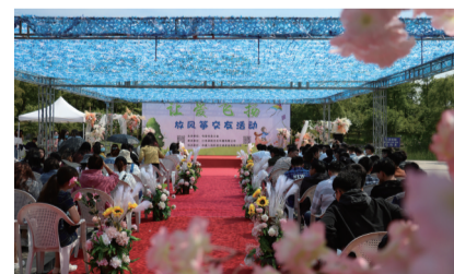
单身职工交友活动

持续放大劳模示范带动效应。积极参与消费助农工作，借助镇江市总工会劳模优质农产品直销会平台，全年共组织50多人次的劳模、农民参加了3场镇江劳模优质农产品直销会，现场销售额达到40余万元。注重发挥农业劳模带头人的示范带动作用，举办了3场农业劳模“传、帮、带”培训班，参加培训的农民人数达400多人。积极开展劳模疗休养工作，有效传递党和国家的高度重视和关心爱护，切实增强劳模的荣誉感和自豪感。2022年，江苏广兴集团有限公司首席技师、总工程师，句容市总工会挂职副主席沈春雷光荣当选党的二十大代表。 积极投身疫情防控、推进乡村振兴、支持实体经济等工作。积极动员各级工会组织、工会党员干部以及句容全市各级劳模有序有力参与疫情防控。联合相关单位，共同举办“e路莓好 大爱容城”2022年句容爱心助农公益直播活动，积极助销地产草莓；联合农业农村局，向社会各界人士发起购买句容茶的倡议，为茶企和茶农纾困解难。不折不扣落实好小微企业工会经费全额返还工作，2022年为1025家小微企业全额退还工会经费444.6万元，返还率达98.2%。落实“消费帮扶、支持对口支援地区两年行动计划”，2022年共动员句容全市各级工会组织70多家，认购陕西蒲城县279.09万元的帮扶产品。