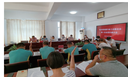
快递行业工会成立