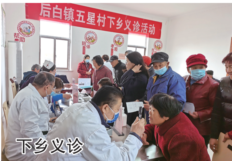
为了提升村民的健康素养,倡导健康的生活方式,预防和控制各种疾病的发生,近日,后白镇五星村联合南京一民医院在五星村居家养老服务中心组织网格员和志愿者开展下乡义诊活动,把医疗服务送到了村民的家门口。

坚持政策引导、服务先行,深入实施“福地句容”工程,积极打造“句满意”的最优人才生态环境。完善人才政策体系,深入实施高校毕业生“群燕齐飞”工程和青年人才“金燕来巢”计划,提供生活补贴、租房补贴、契税补贴、见习补贴、创业扶持、人才奖补等25项支持政策,用真金白银普惠人才、留住人才。优化人才公共服务。建立人才服务专窗、人才服务专线、人才服务专员机制,开通生活补贴、租房补贴、见习补贴线上申报系统,全力做好人才政策解答、人才补贴落实、毕业生档案管理服务,和人才集体户落户等工作。2022年,先后发放高校毕业生生活补贴和租房补贴213.93万元,惠及496名高校毕业生。