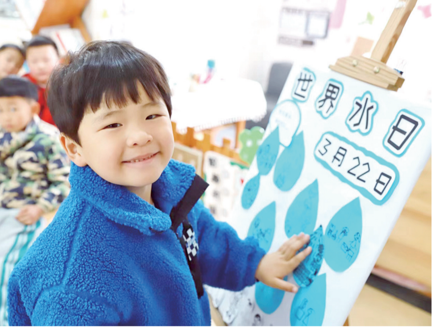
节水先行 点滴在心

在空气中,这些过敏原容易诱发哮喘。春天气温变化比较大,感冒也是诱发或加重支气管哮喘的重要原因。