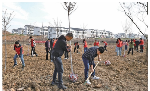
美化新家园 为大地添新绿

树暨护绿主题党日活动。 活动现场,大家挖坑、放苗、回填、浇水……经过2个多小时的分工合作,100余棵由镇江移动谏壁分局提供的小树苗在第十中学安家,栽好的小树苗迎风摇曳,现场洋溢着欢声笑语。