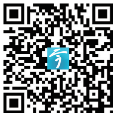
云上 看直播 扫描二维码

师作品。这些书法作品有的取法经典,有的来自民间,其中不乏发源于传统且兼具创造力的优秀作品。参赛书法教师既有刚成年的在校大学生,也有耄耋之年的老书法家,跨越了“老中青”三代,实现年龄“全覆盖”。 组委会工作人员透露,首届“米芾杯”全国青少年书法教师作品展将展出优秀书法篆刻作品(米芾奖)7件、书法篆刻入展作品123件,共计130件。从入展作品来看,一些书法指导老师已经写出了“国展”的水平,其精深功底可见一斑。 3月14日下午2:30,锁定“今日镇江”APP,期待与您“云”上相见。