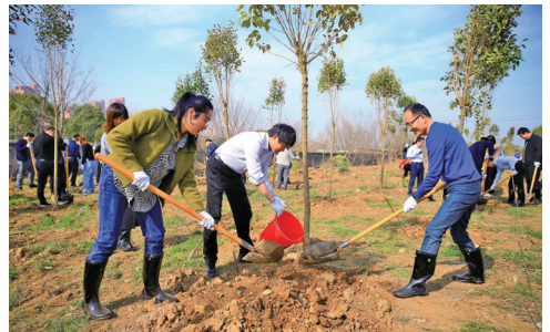
履行植树义务 共建美丽京口

工合作,有的挖坑、有的扶苗、有的浇水、有的填土……整个植树现场呈现出一片忙碌的景象。经过近2个小时的努力,一棵棵新栽种的树苗昂首挺立,在明媚春光中焕发出勃勃生机。 据了解,南山风景区作为城市绿肺、“省级互联网+全民义务植树”基地,有树木、花卉360余种。园区内种有5万余株杜鹃花,可以说南山是镇江市的“市花园”。通过活动,大家更加了解了镇江的市花,同时也为南山景区、我们的城市增添了一份绿色。